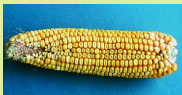
ROGER RIVEST, MAPAQ

quents dans un sol à pH supérieur à 7 ou dans un sol acide à texture sablonneuse.