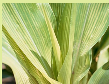
D.A. WHITNEY, APS PRESS

ferreux ou de chélate de fer peut corriger la situation.