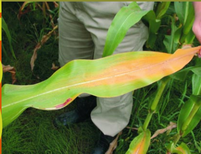
LA COOP FÉDÉRÉE