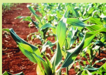
POTASH & PHOSPHATE INSTITUTE

On peut prévenir la carence par l'application de cuivre au sol en présemis. Cet épandage corrige le