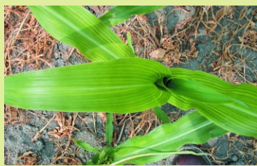
LA COOP FÉDÉRÉE

Le manganèse est un élément immobile dans la plante. Les symptômes apparaissent sur les nouvelles feuilles. On observe des bandes jaunes entre les nervures des feuilles. La tige est rabougrie. Les carences en manganèse et en magnésium présentent des symptômes semblables. Dans les deux cas, on observe des feuilles striées de bandes jaunes. Pour les différencier, il faut regarder la position des feuilles affectées. Dans le cas du manganèse, les symptômes apparaissent sur les feuilles du haut. Pour le magnésium, ils apparaissent sur les feuilles du bas.