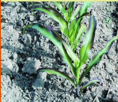
ROGER RIVEST, MAPAQ

L'application d'azote en fractionnement corrige la déficience. On peut utiliser plusieurs sources d'azote.