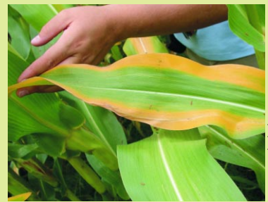
LA COOP FÉDÉRÉE

Le potassium est un élément mobile dans la plante. Des feuilles plus étroites que la normale sont le premier indice d'une carence. Les symptômes apparaissent sur les feuilles du bas. Un jaunissement débute au bout des feuilles et progresse le long des bordures. La tige fendue sur le sens de la longueur révèle une couleur brunâtre aux nœuds. Les épis sont petits, souvent tordus et les grains mal formés. Une carence en potassium diminue la résistance de la plante aux maladies fongiques.