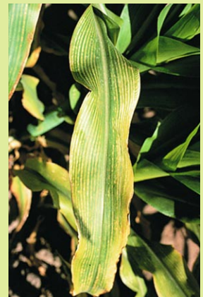
D.A. WHITNEY, APS PRESS

Une application foliaire de sulfate de magnésium est efficace pour corriger la carence. On peut aussi ajouter du magnésium au démarreur si l'analyse de sol indique une déficience de cet élément. De la chaux dolomitique, appliquée à la volée avant le sarclage, corrige le problème à long terme.