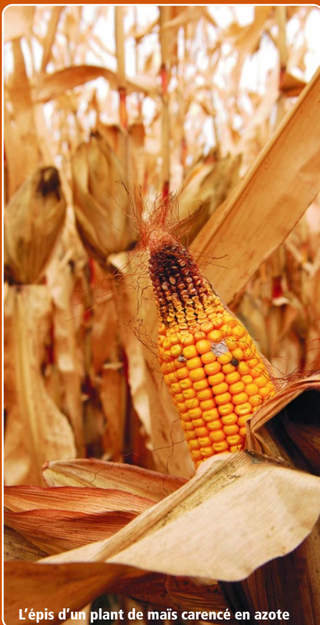
L'épis d'un plant de maïs carencé en azote