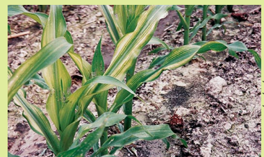
LA COOP FÉDÉRÉE

Les sols avec un pH supérieur à 7 sont plus sensibles à cette carence. Les sols sablonneux faibles en matière organique et ceux avec un