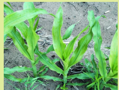
ROGER RIVEST, MAPAQ

Les problèmes de carence de soufre se corrigent par l'application